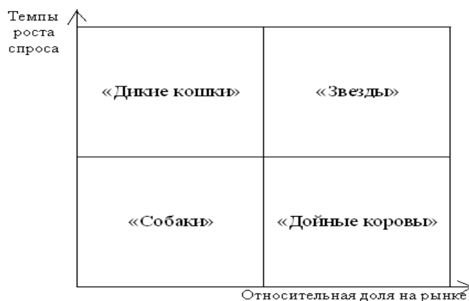
Рис.1. Матрица БКГ

«Звезды» занимают лидирующее положение в развивающейся отрасли. Они приносят организации значительные прибыли, но одновременно требуют значительных ресурсов для финансирования продолжающегося роста. Стратегия для «звёзд» направлена на увеличение или поддержание высокой их доли на рынке, а также в поддержании отличительных преимуществ товаров в условиях растущей конкуренции.